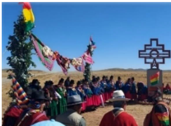
Gráfico 7 La cruz Andina – Ingreso a la Comunidad de Pallina Grande

☐ Decidir: es cómo se quiere cambiar el futuro del país, el niño debe estar decidido a realizar cambios para mejorar el diario vivir.