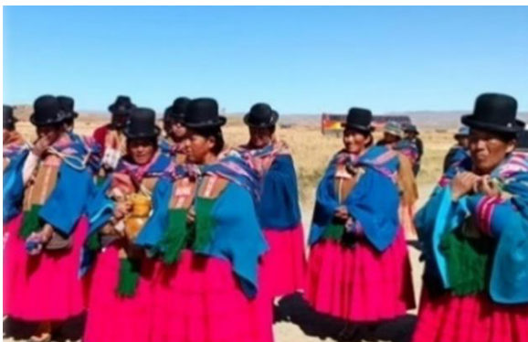
Gráfico 4 Esposas de las Autoridades de Pallina Grande - Mama Mallkus