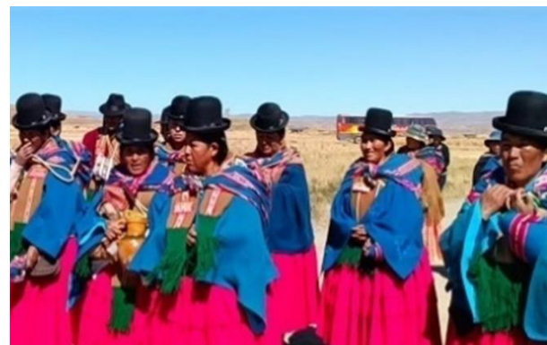
Gráfico 12 Vestimenta típica de las esposas de las autoridades – Mama Mallku

Las autoridades originarias tienen prohibido usar medias nailon, porque en la central agraria campesina de Viacha controla en los desfiles.