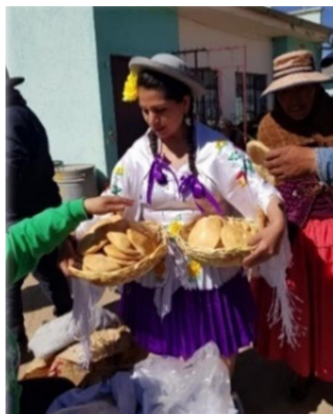
Gráfico 17 Compartiendo el pan tradicional de Tarija