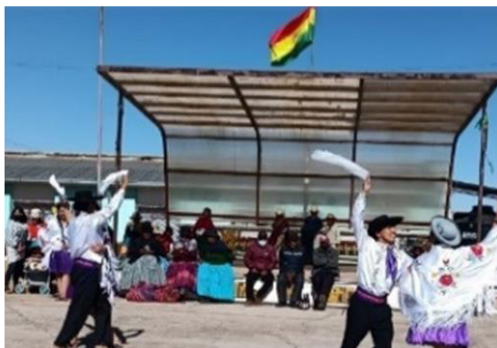
Gráfico 15 Demostración de la cueca chapaca por la Delegación de Tarija

Como delegación de Tarija, se participó activamente del intercambio cultural y por ello mostramos un poquito de los bailes típicos de nuestra región, entre ellos la rueda, la cueca y el bailecito.