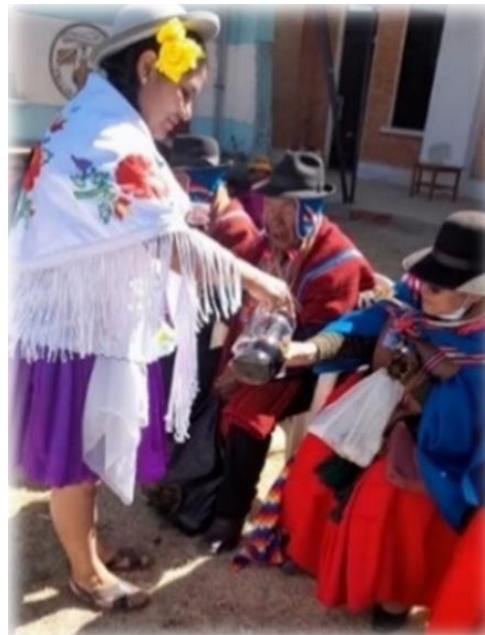
Gráfico 16 Compartiendo con los comunarios el vino patero tradicional de Tarija

Asimismo, se compartió durante el apthapi el tradicional pan de San Lorenzo, pan con quesito, pan cáspita, pan bollito. Así también, se compartió uno de los productos característicos de Tarija como es el vino patero.