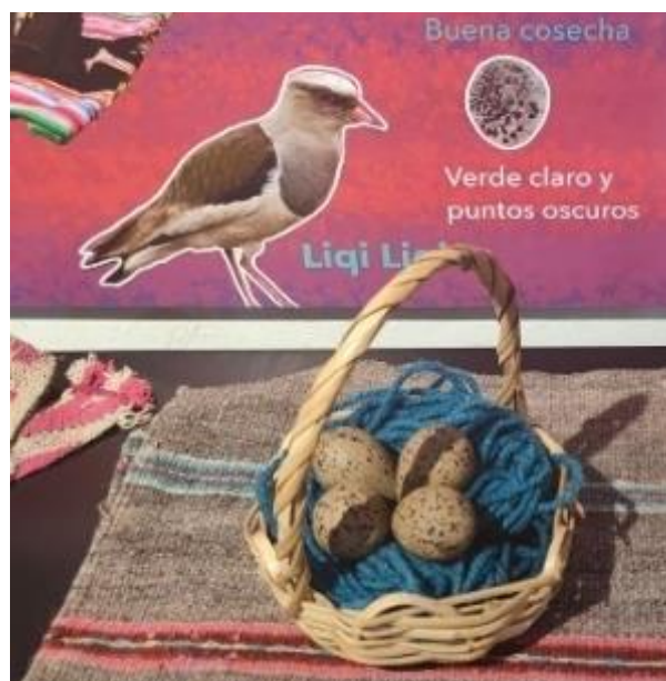
Gráfico 6 Ave Liqi liqi

Los ancestros de la comunidad calculaban donde sembrar, según donde el ave Liqi Liqi, que habita en la comunidad de Pallina Grande haga su nido y ponga sus huevos; si el Liqi Liqi pone sus huevos en pajonales o terreno plano, será un año poco lluvioso, entonces deben sembrar en terreros planos, si el Liqi Liqi pone sus huevos en una lomita será un año muy lluvioso y para que no se inunde la siembra, tienen que sembrar en terrenos altos y si el Liqi Liqi pone sus huevos en pampa donde se estanca el agua, será un año seco, entonces deben sembrar en terreno en formas de hoyos y el terreno permanezca húmedo; también los ancestros decían que, si el huevo del Liqi Liqi tenía manchas, habría buena producción. Una característica bien particular es que el ave Liqi Liqi solo pone huevos desde el mes de septiembre hasta el mes de enero.