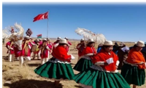
Gráfico 10 Danza tradicional la Lakita, con su propio conjunto y vestimentas coloridas

Para las festividades, las personas de la comunidad suelen usar colores extravagantes que resaltan como ser; el naranja, el rosado y el blanco, para demostrar que están felices en ese tipo de festividades y sobre todo con la comunidad, el atuendo de cada autoridad representado por un color también tiene un significado, los que son encargados de los sembradíos llevan el color negro.