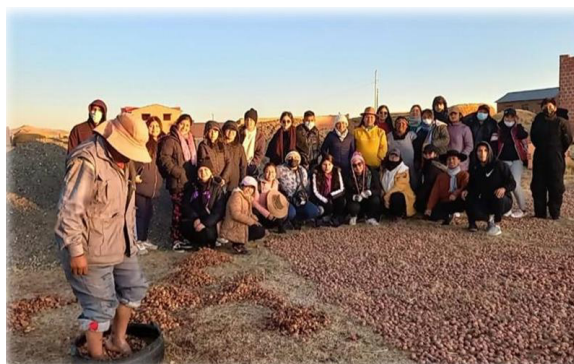
Gráfico 14 Conociendo la elaboración y el pisado de chuño Ritos y mitos

¿Por qué pisan el chuño? Es una costumbre que viene de generación en generación. Hoy en día en la comunidad de Pallina Grande aún realiza esta labor, se trata de una costumbre heredada de sus ancestros, quienes la pusieron en práctica para conservar la papa como alimento para el invierno.