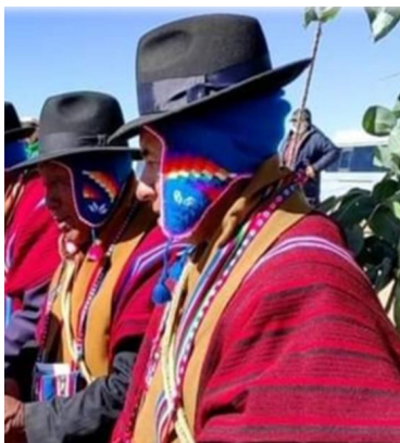
Gráfico11 Vestimenta típica de las máximas autoridades Mallku

La chuspa multicolor, significa amistad de la autoridad para con su semejante y con sus bases. En la chuspa portan hojas de coca y alcohol para la ch'alla, etc.