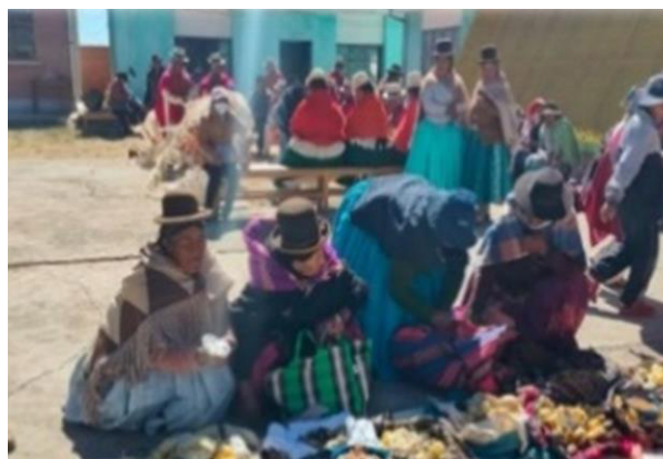
Gráfico 8 Madres de familia preparando el Apthapi

La palabra Apthapi en aymará significa “traer”. El apthapi es una práctica comunitaria de hermandad, siempre se lleva a cabo en fiestas agrícolas o festividades de la comunidad, consiste en que todos los miembros de la comunidad lleven los alimentos que se produce en este tiempo para compartir con su gente. Cabe recalcar que si algún comunario no puede llevar algo los demás no lo juzgan por el contrario todos son bienvenidos a participar del apthapi y traer lo que puedan.