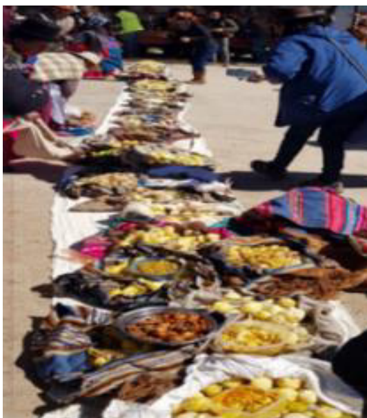
Gráfico 9 Comunarios compartiendo el Apthapi