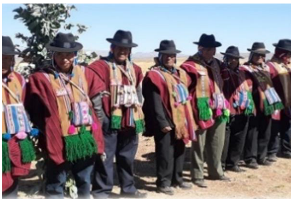
Gráfico 3 Autoridades de la Comunidad de Pallina Grande - Mallkus