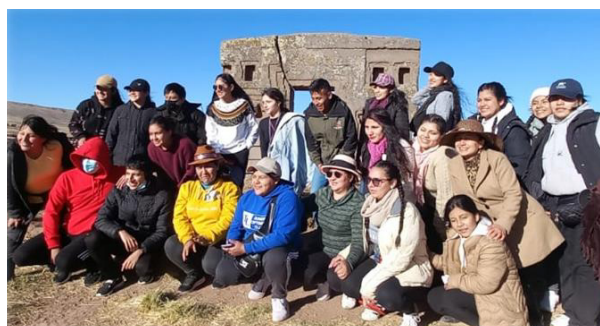
Gráfico 20 Visitando la comunidad de Tiwanacu

En el acto de inauguración del Museo se tuvo la presencia de diferentes Autoridades Municipales, Departamentales y Nacionales, como también invitados especiales como el conocido chasqui boliviano, personeros de la Embajada Americana, entre otros; quienes realizaron la invitación a la Delegación para que pudiésemos visitar el Municipio de Guaqui y Tiwanacu, pero por el factor de tiempo solo pudimos visitar este último, quedando el compromiso de poder generar un nuevo encuentro de culturas departamentales.