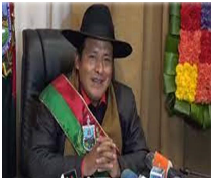
Gráfico 1 Gobernador del departamento de La Paz