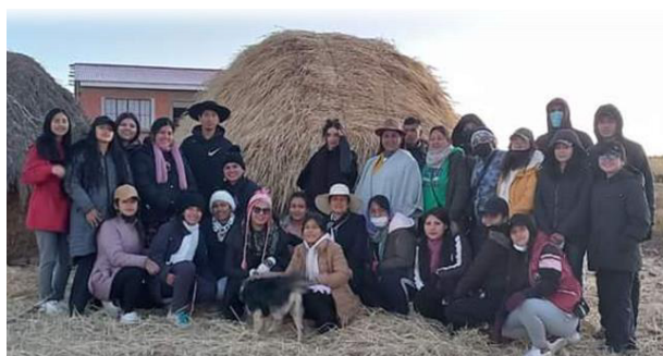
Gráfico 19 Visitando la Comunidad de Pallina Grande – compartiendo con los comunarios

Durante los días que estuvimos en la Comunidad de Pallina Grande, se realizó la visita a las diferentes casas de los comunarios para observar su diario vivir, realizar algunas entrevistas, compartir sus actividades diarias.