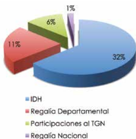
Figura 1: Distribución ingresos departamentales