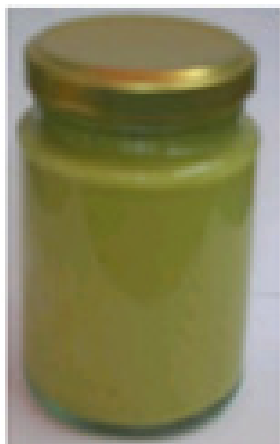
Figura 2. Crema dulce de palta envasada en envases de vidrio