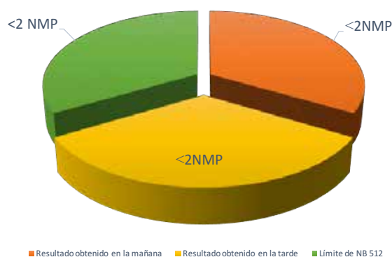
GRÁFICO N° 1: Resultado del recuento de bacterias de coliformes totales y fecales

Los resultados que se muestran en el cuadro anterior del análisis físico-químico realizado al agua en la comunidad de San Alberto, nos indican que la mayoría de los parámetros tienen valores que se encuentran dentro de lo establecido por la norma boliviana 512, se han determinado 2 parámetros que sobrepasan el límite de la NB 512; tal es el caso del manganeso con 0,23 mg / l, mientras que la norma establece un valor límite de 0,1 mg / l; y el bario con un valor de 1,42 mg / l, sobrepasando el límite permisible de 0,7 mg / l.