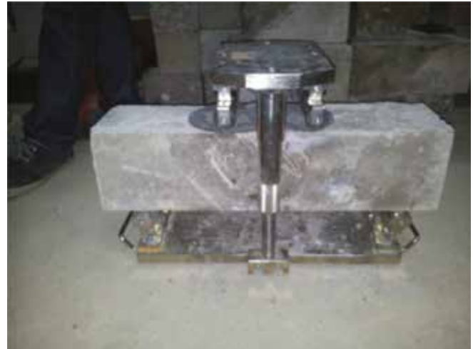
Figura 2. Ensayo a flexión

La información de los datos para la rotura de probetas se basara en el procedimiento probabilístico de muestreo aleatorio simple, es decir cada medición tendrá una muestra de 11 probetas para las vigas que serán ensayadas a flexión haciendo un total de 55 vigas y 3 probetas cilíndricas para el ensayo a compresión.