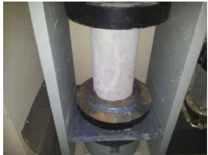
Figura 3. Ensayo a compresión

La información de los datos para la rotura de probetas se basara en el procedimiento probabilístico de muestreo aleatorio simple, es decir cada medición tendrá una muestra de 11 probetas para las vigas que serán ensayadas a flexión haciendo un total de 55 vigas y 3 probetas cilíndricas para el ensayo a compresión.