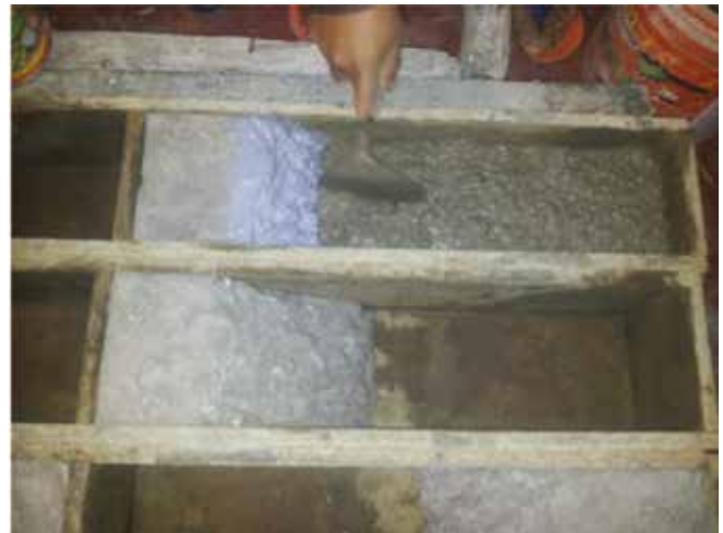
Figura 1. Elaboración de probetas

Además se realizará la elaboración de probetas patrón para establecer los rangos máximos y mínimos entre los cuales se supone deben estar los valores de las vigas con tratamiento de junta.